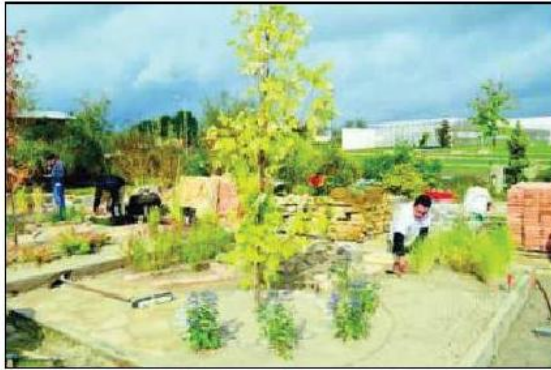
Lors de la soirée de clôture, un arbre sera symboliquement planté.