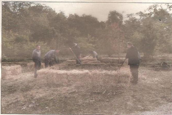
La création d'un carré pour les plantes aromatiques.