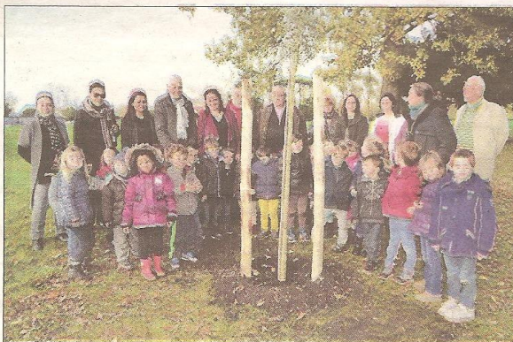
Plantation de trois chênes liège avec les enfants de la maternelle La Renney.